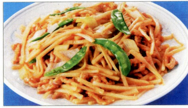
ジャンバオチティン 11 醬爆鶏丁 鶏肉の中国味噌炒め