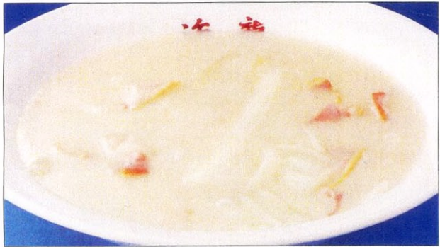
ナアイウバツァイ 27 奶油白菜 白菜のクリーム煮 大 950 円 小 600 円