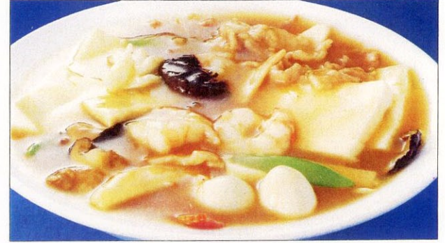
スッチンドウフ 29 什景豆腐 五目煮込み豆腐 大 1,600 円 小 930 円