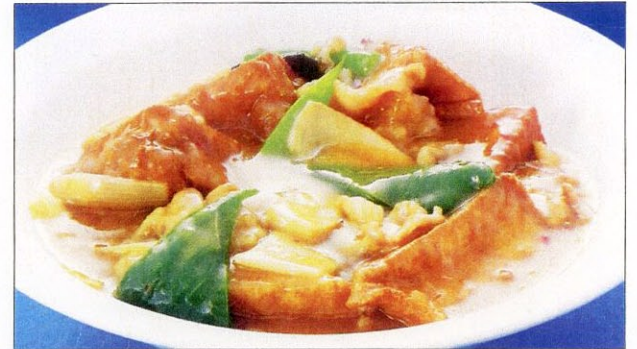
ジャシヤンドウフ 32 家常豆腐 揚げ豆腐のピリ辛煮込み 大 1,550 円 小 920 円