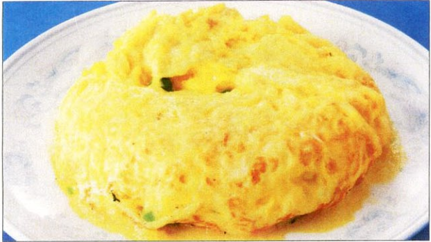
フウヨンハイタン 25 芙蓉蟹蛋 カニ玉 大 1,500 円