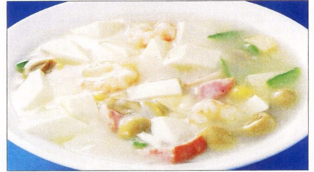
シアレンドウフ 31 蝦仁豆腐 エビと豆腐の煮込み 大 1,600 円 小 930 円