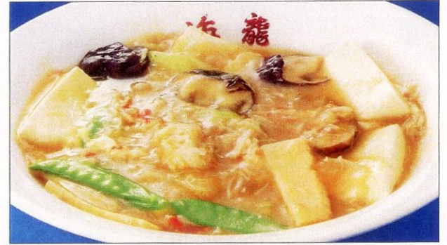
シェフェンドウフ 30 蟹粉豆腐 カニと豆腐の煮込み 大 1,600 円 小 930 円