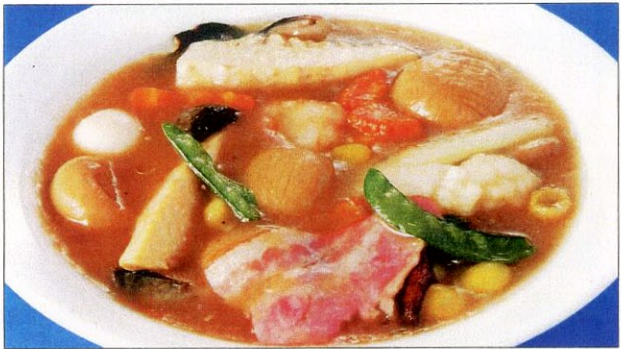
バアボウツァイ 26 八宝菜 ハッポウサイ 大 1,550 円 小 930 円