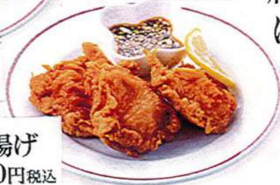
中華風鶏の唐揚げ 3ヶ600円税込