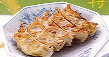
長岡金子の餃子 5ヶ490円税込 3ヶ350円税込