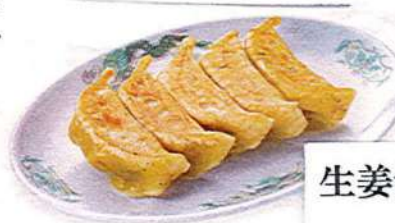
生姜餃子 5ヶ510円税込 3ヶ370円税込