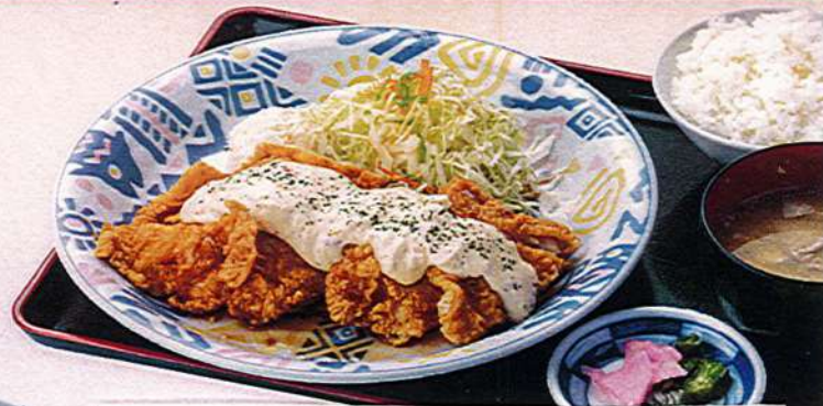
チキン南蛮定食 1,130円税込