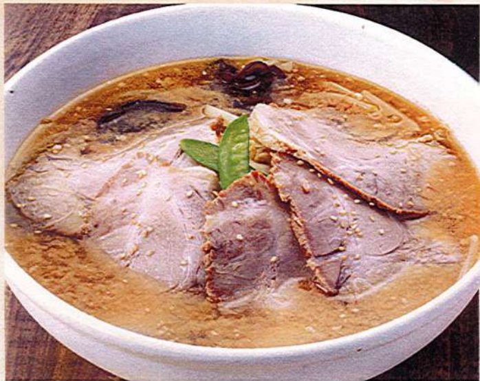
野菜みそチャーシューメン 1,350円税込