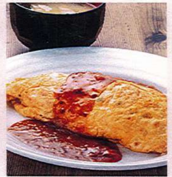
オムライス(ミニサラダ付) 1,020円税込