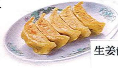
生姜餃子5ヶ510円税込 3ヶ370円税込