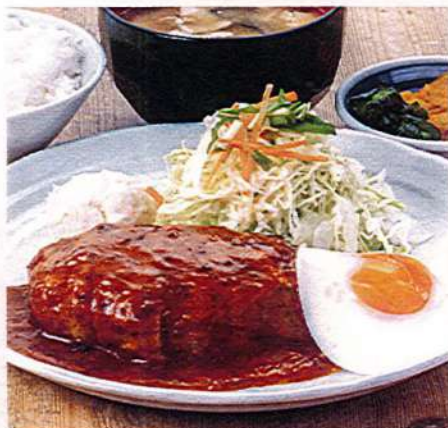
ハンバーグ定食 1,280円税込