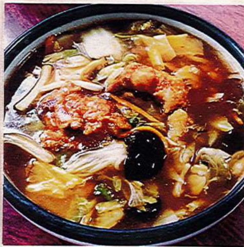
うま煮ラーメン 980円税込