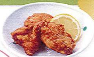
鶏の唐揚げ 3ヶ560円税込