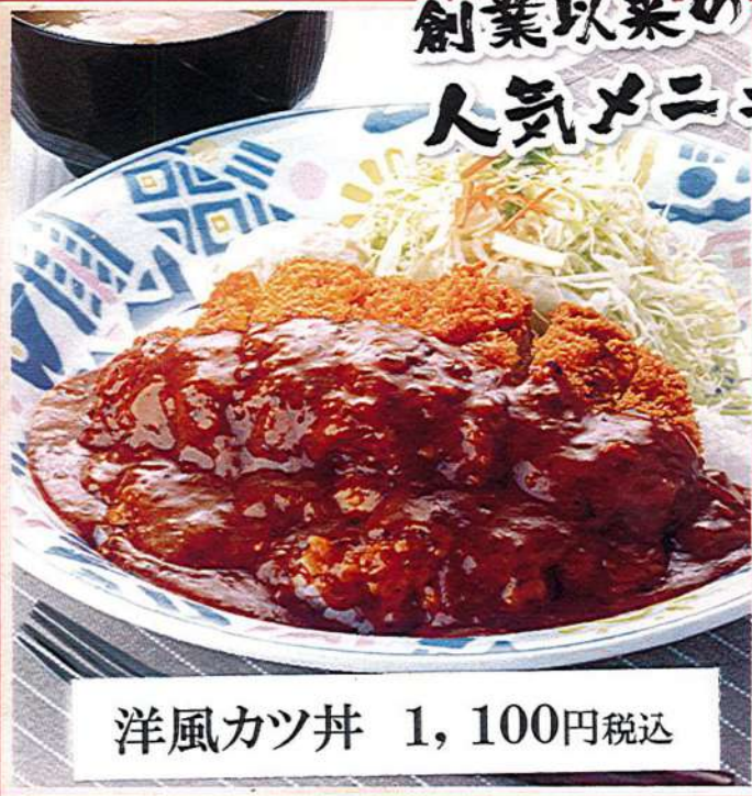
洋風カツ丼 1,100円税込