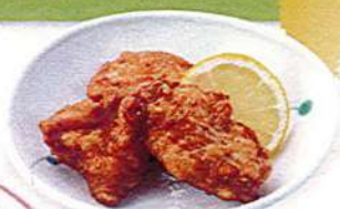
鶏の唐揚げ 3ヶ560円税込