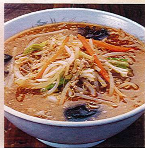
野菜みそラーメン 930円税込