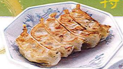
長岡金子の餃子 5ヶ490円税込 3ヶ350円税込