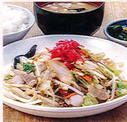
野菜炒め定食 1,100円税込