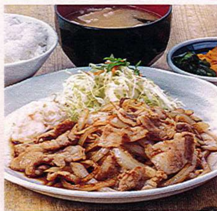
豚バラ生姜焼き定食 1,200円税込