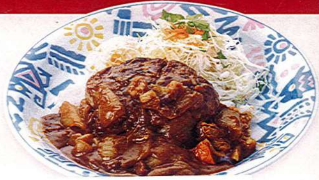
ハンバーグカレー 1,250円税込