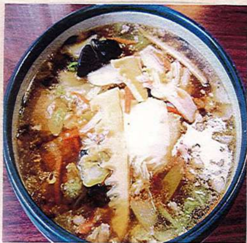
カラジャン麺 980円税込