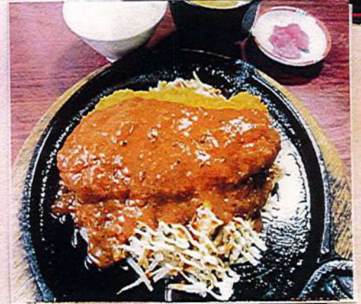
お好み焼き風鉄板とんかつ定食 1,250円税込