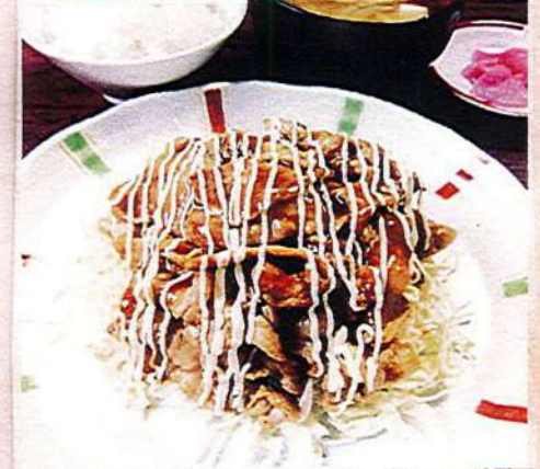
豚カルビ定食 1,080円税込