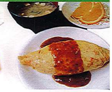
オムライス 680円税込