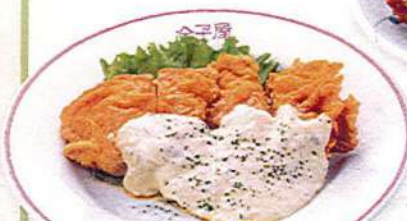
チキン南蛮 2ヶ540円税込