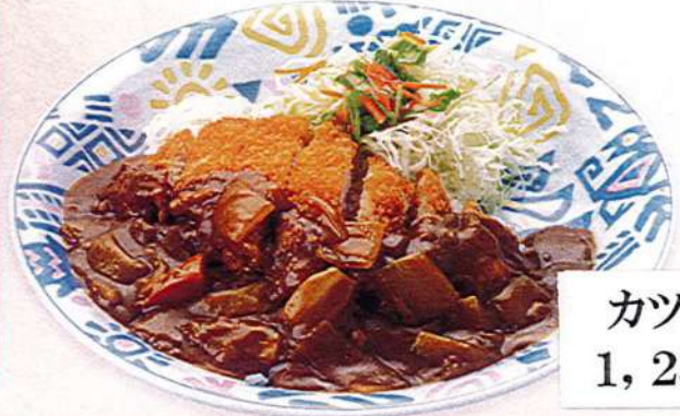
カツカレー 1,250円税込