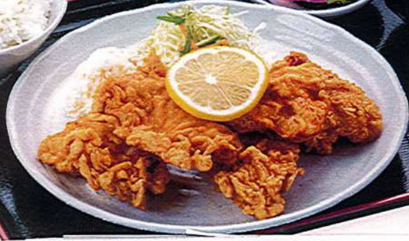
中華風鶏の唐揚げ定食 1,100円