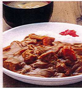
カレーライス 900円税込