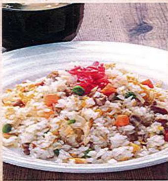
チャーハン 890円税込