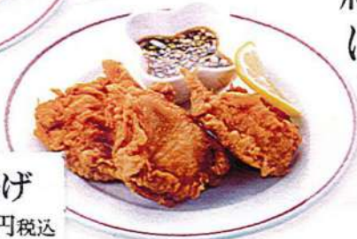
中華風鶏の唐揚げ 3ヶ600円税込