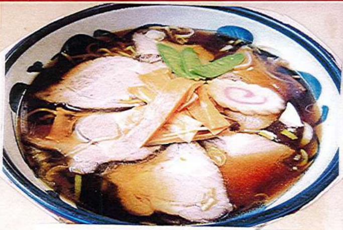
チャーシューメン 1,150円税込