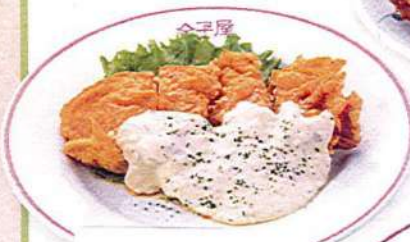
チキン南蛮 2ヶ540円税込