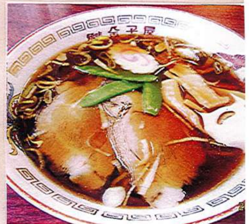
醤油ラーメン 830円税込