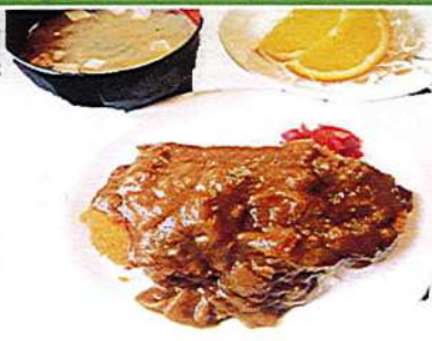
カツカレー 720円税込