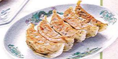
しそ餃子 5ヶ510円税込 3ヶ370円税込