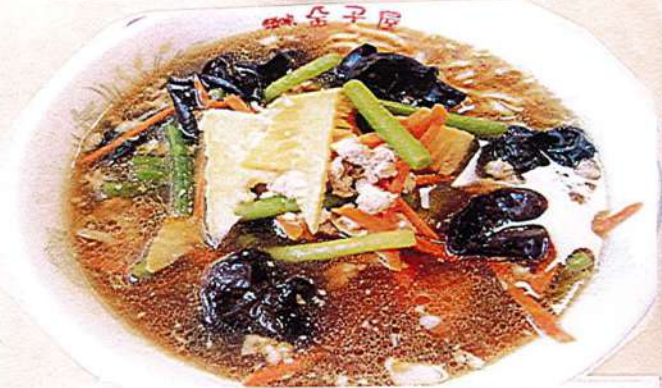
スタミナラーメン 930円税込