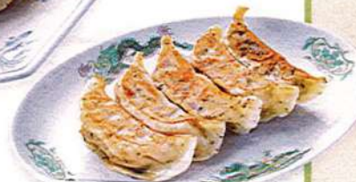
しそ餃子 5ヶ510円税込 3ヶ370円税込