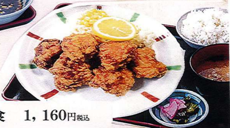
唐揚げ定食 1,160円税込