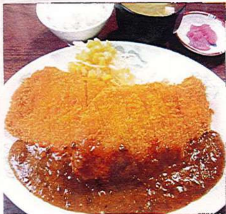
ダブルとんかつ定食 1,980円税込